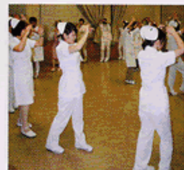
仕事が終わってからの練習風景 (ああ…手と足があ～)

踊りは「おはら節」と「はんや節」 の二種類。はんや節は南風病院オ リジナルの踊りがあるので、 新人の職員は本番当日まで 猛練習を重ねます。