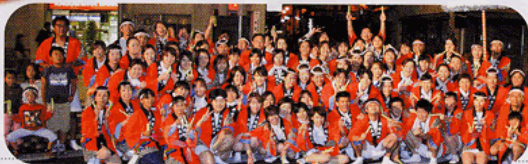
薩摩おこじょの美女たち