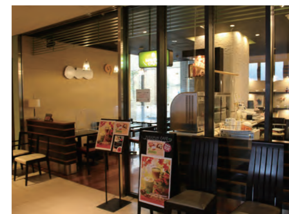
Nanpuh Café (南風カフェ)