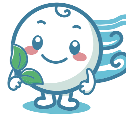
南風病院 公式マスコットキャラクター みなミン