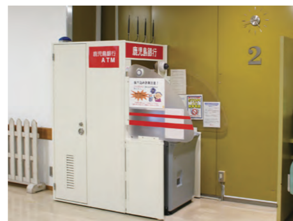
キャッシュコーナー