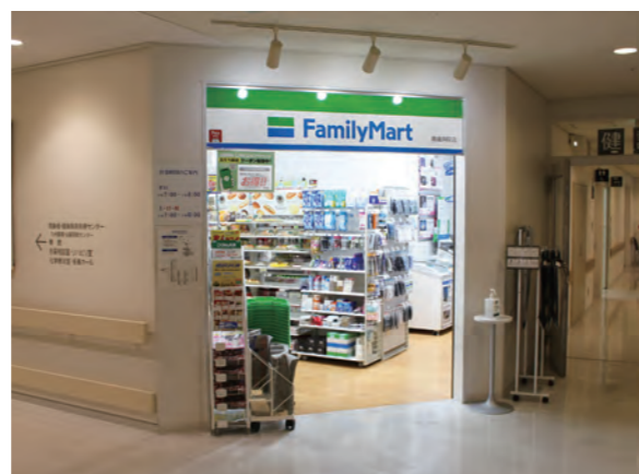
コンビニエンスストア