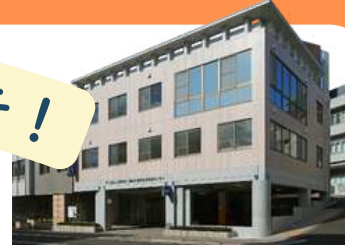
高齢者・健康長寿医療センター